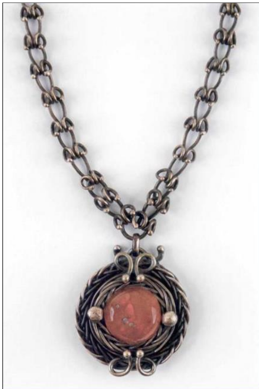
Kaklo papuošalai. Žalvaris, gintaras