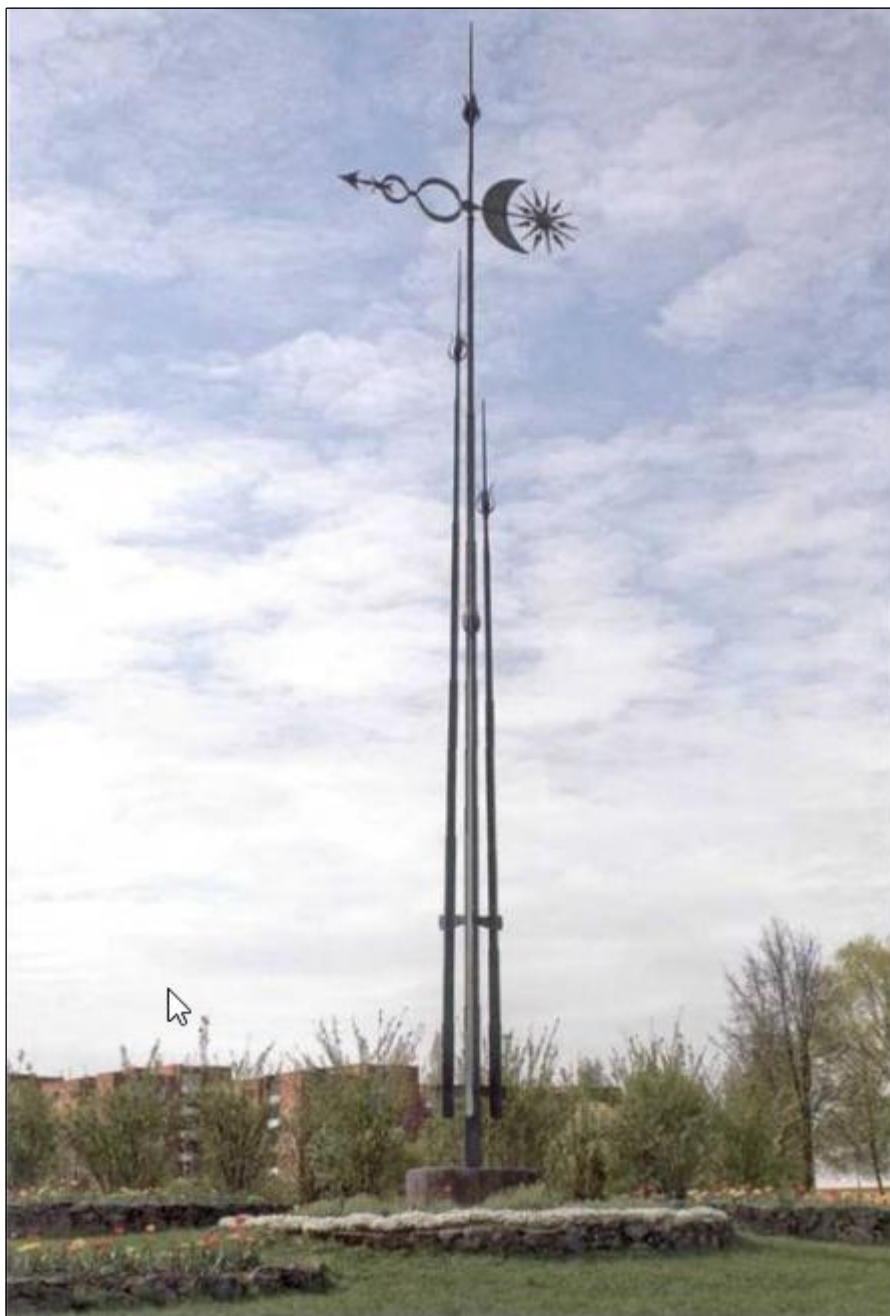
Vėtrungė. Geležis, hl6 m, Alytus, 1985 m.