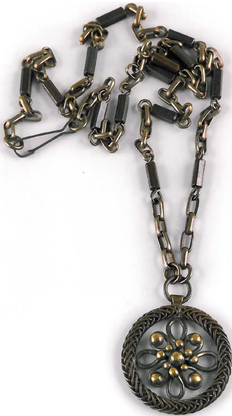
Juvelyrika. Kaklo papuošalai. Žalvaris