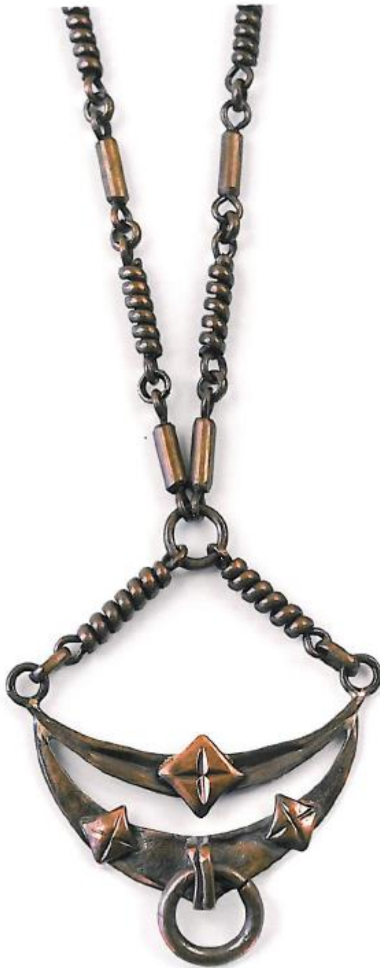
Kaklo papuošalai. Žalvaris