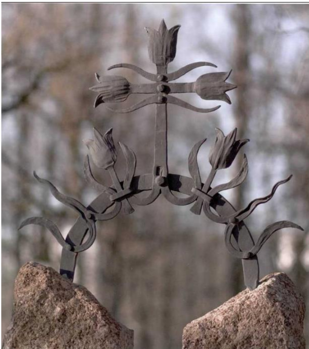
Skulptūrinė kompozicija "Tekanti saulė". Fragmentas Prie malūno Užventyje, 2009 m.