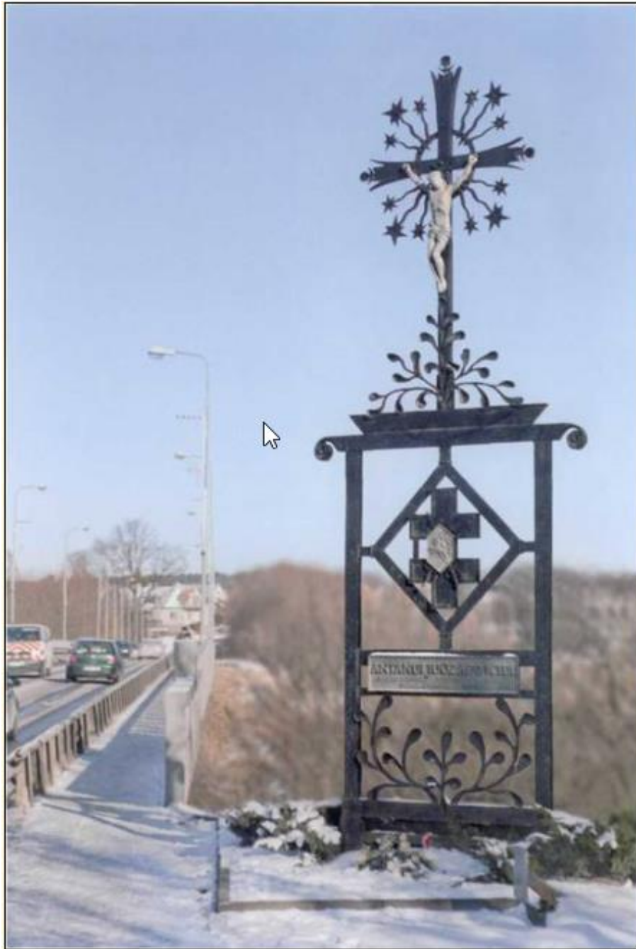
Paminklas Antanui Juozapavičiui (pirmajam karininkui, žuvusiam už Lietuvos nepriklausomybę, 1919 m.) Alytuje, 1989 m.