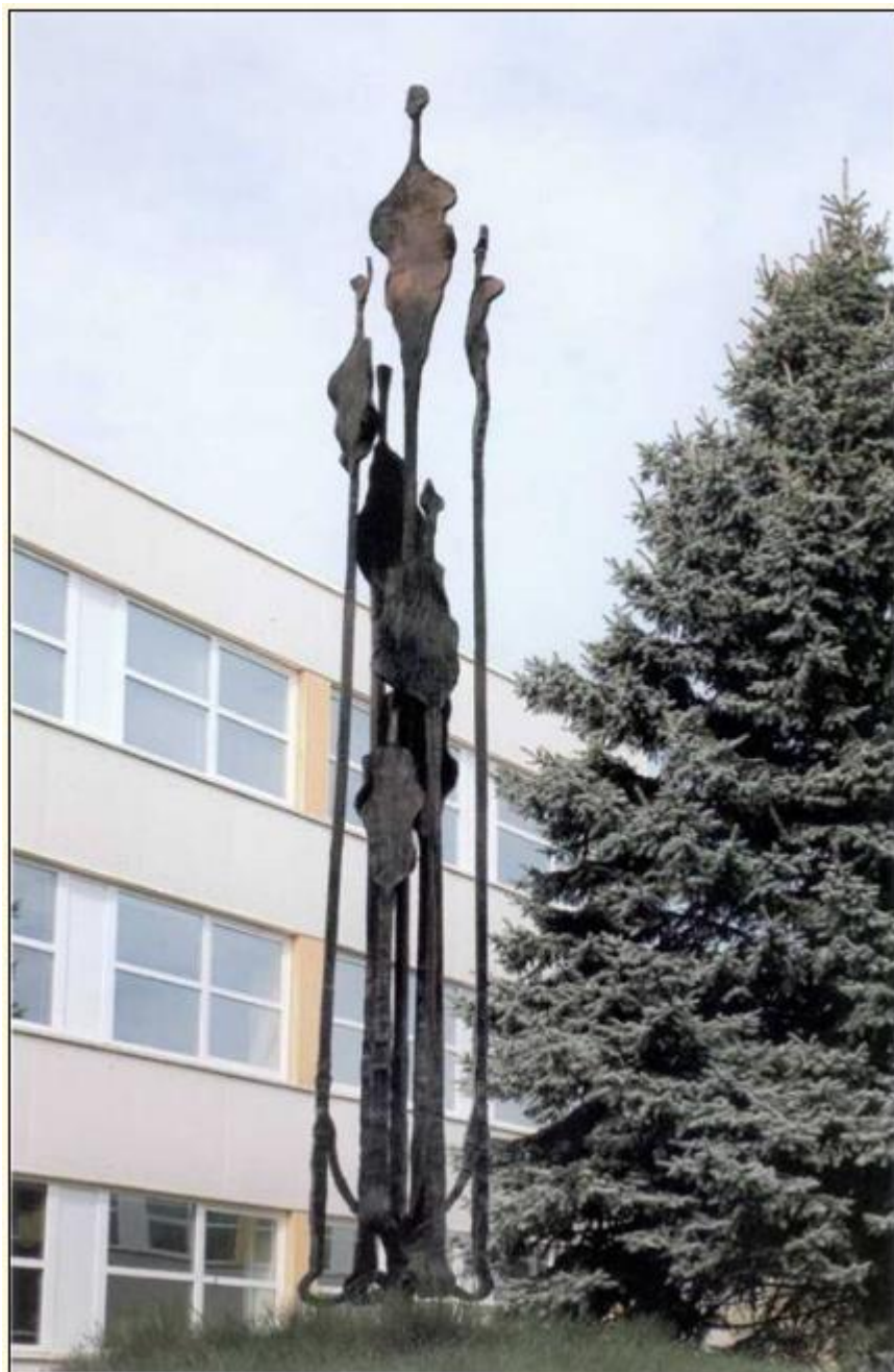
Skulptūra "Pavasaris" Alytaus Putinų mokyklos kiemelyje, 1984 m.