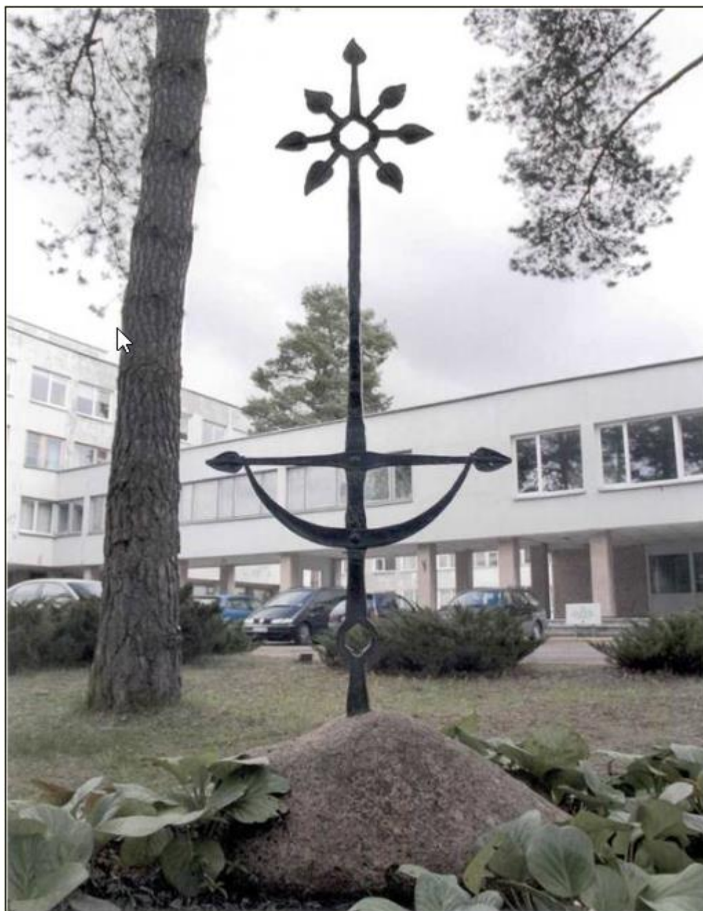
Skulptūrinė kompozicija. Geležis, h280 cm, Druskininkų "Saulutės" sanatorijos kieme, 1996 m.