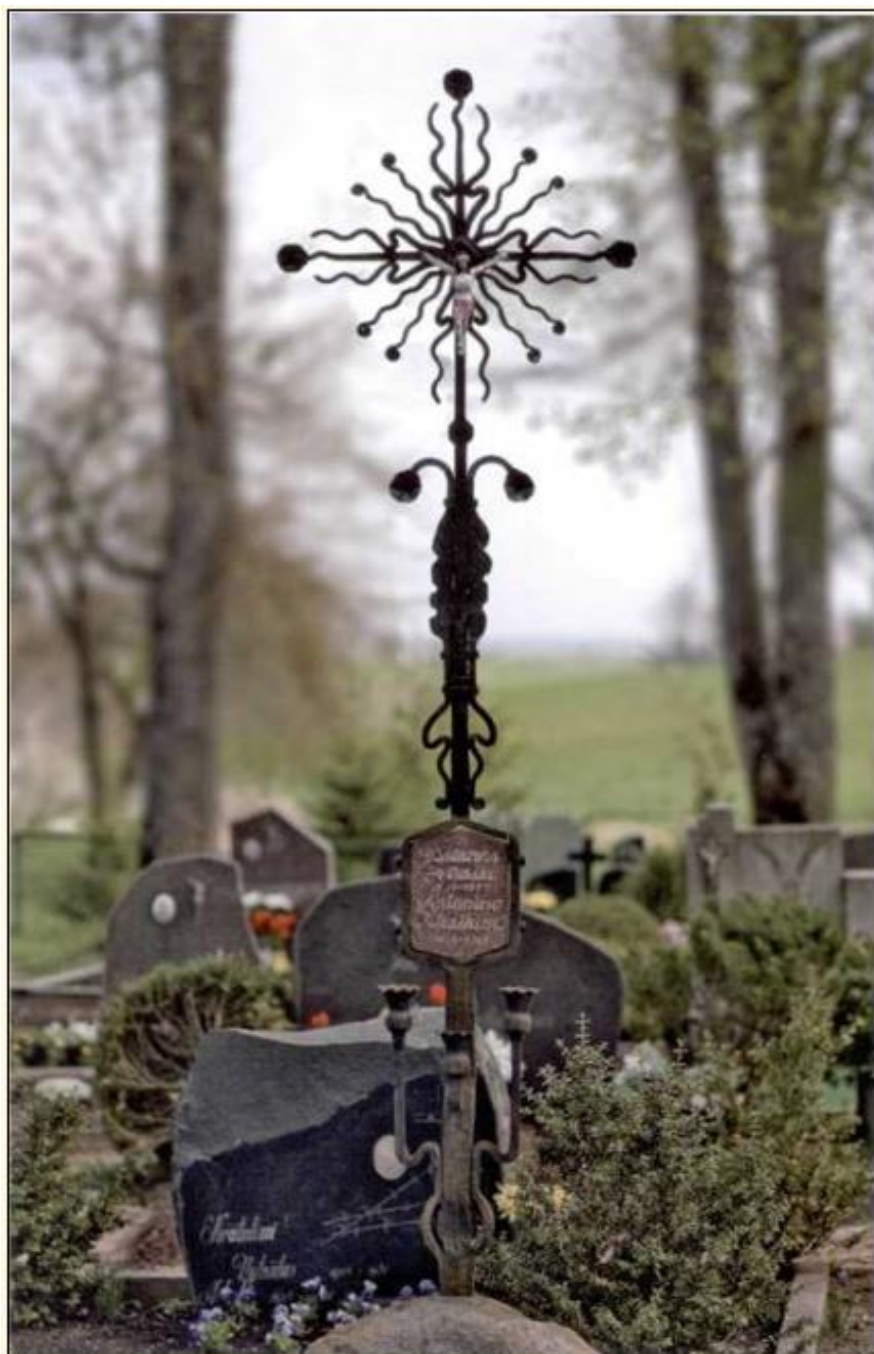
Antkapinis paminklas. Geležis, 320 x 70, Ūdrijos m., Alytaus r., 1978 m.