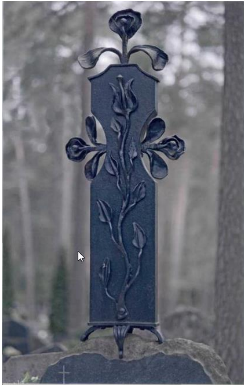
Antkapinis paminklas. Geležis, 180 x 60 cm, 1982 m.