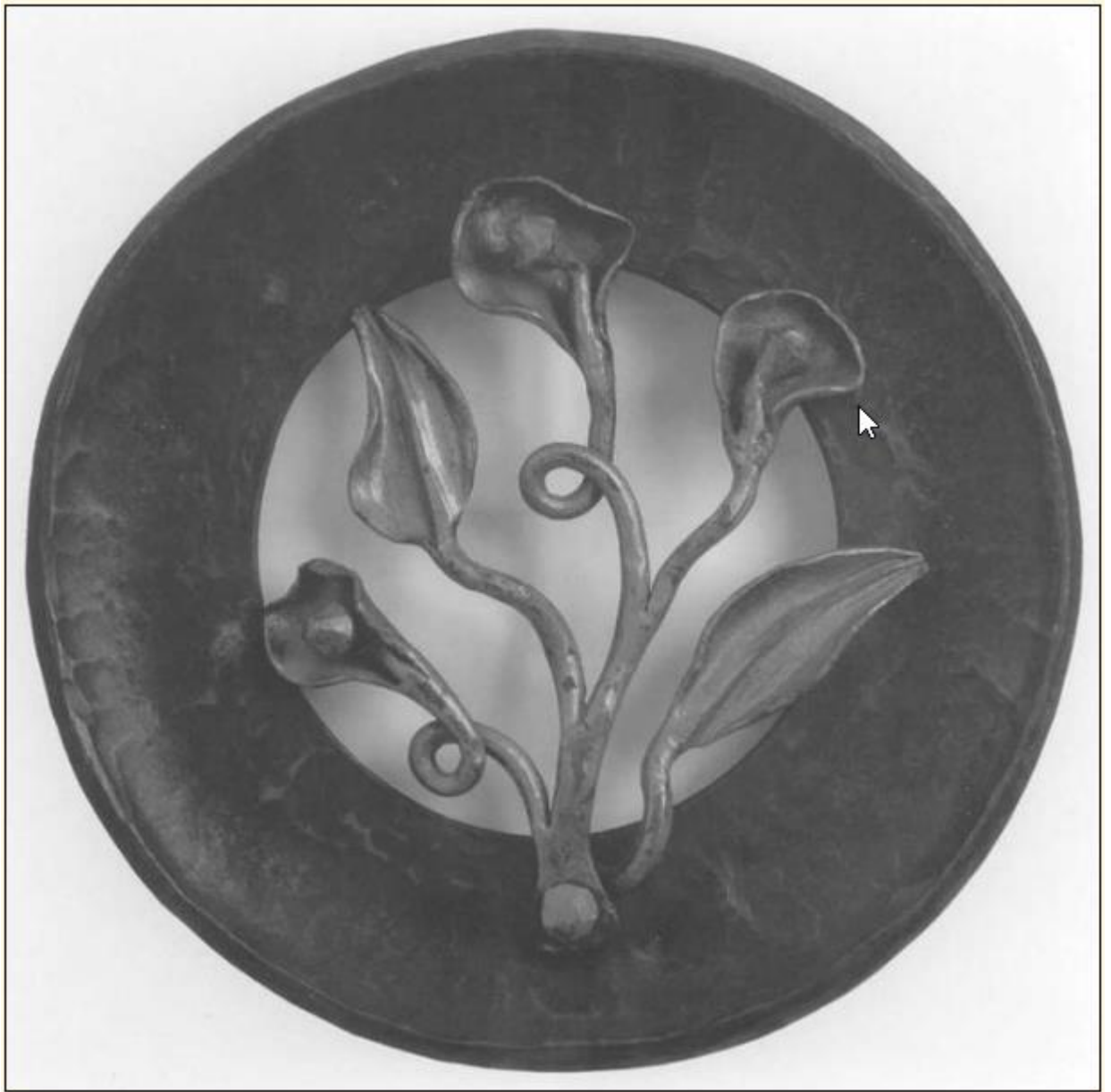
Dekoratívne lékště. Geležis, 30 x 30 cm