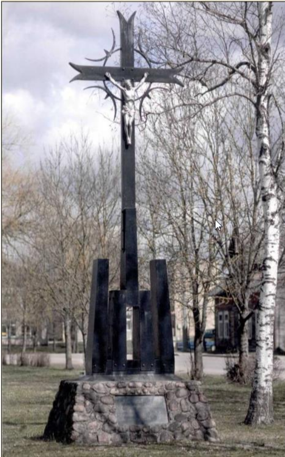
Paminklas bolševizmo aukoms atminti Eržvilke, Jurbarko r., 1990 m.