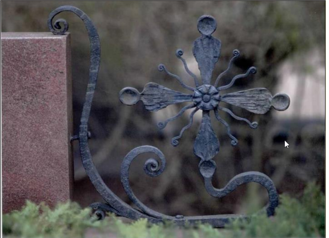
Antkapinis paminklas. Geležis, 70 x 80 cm, 1977 m.