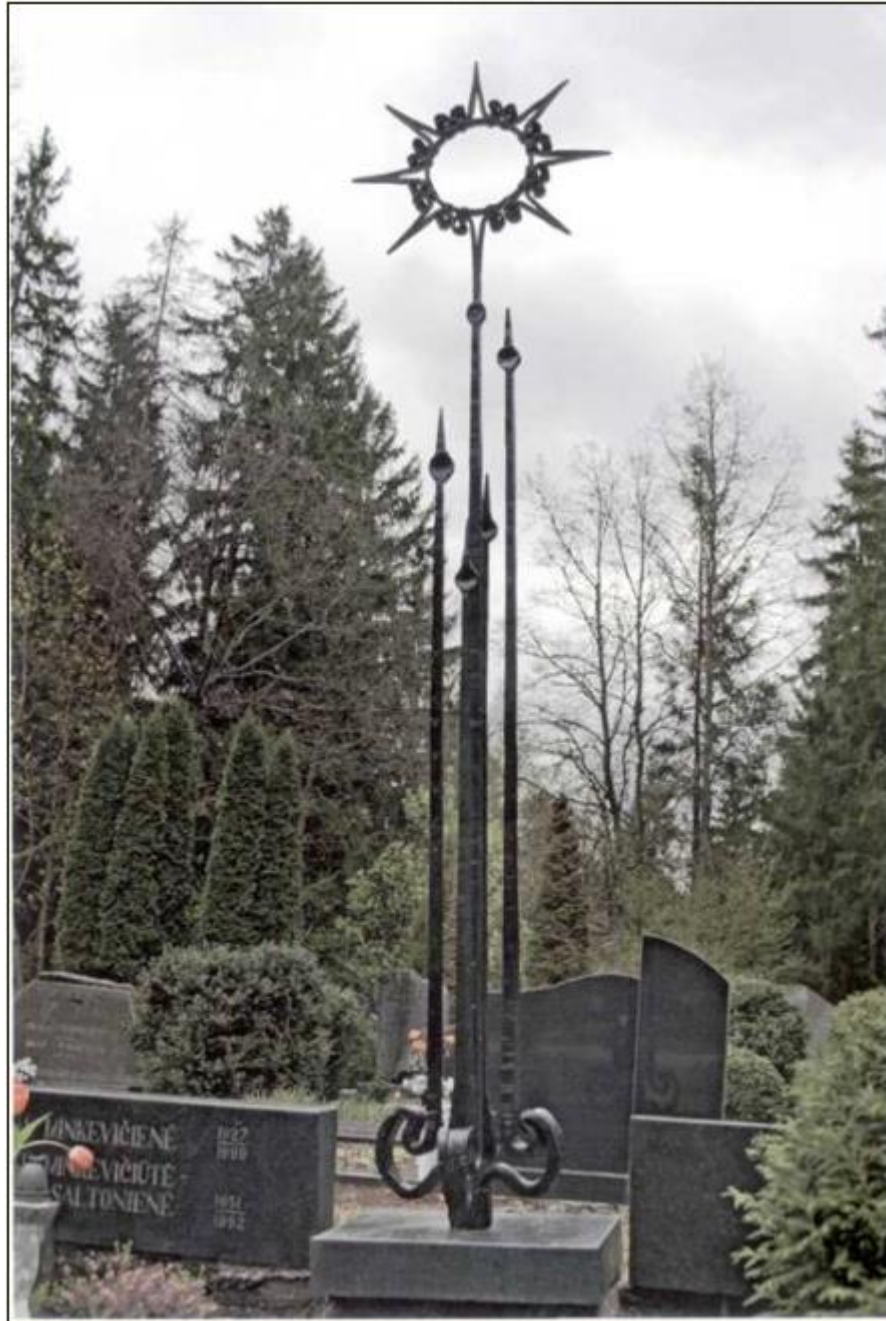
Antkapinis paminklas. Geležis, h290 cm, 1979 m.